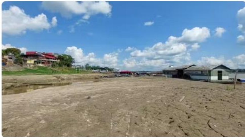
Rio Solimões durante estiagem de 2024, no município de Tabatinga, interior do Amazonas.