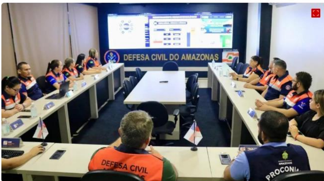
Reunião entre autoridades do Amazonas para debater estiagem de 2024